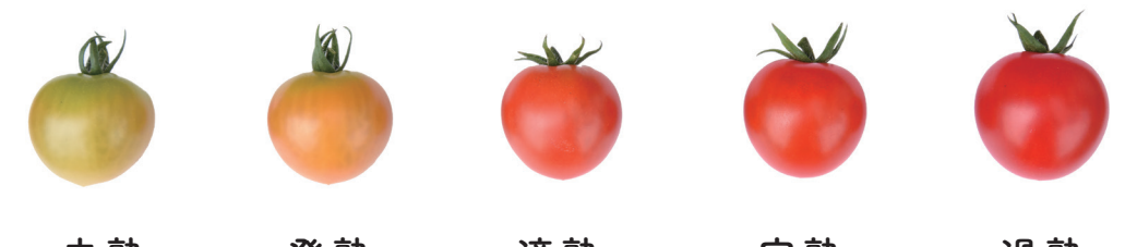
ピッコラルージュCF