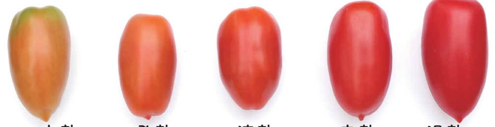
サンマルツァーノリゼルバ