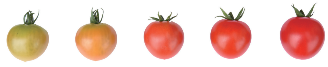
アマルフィの誘惑