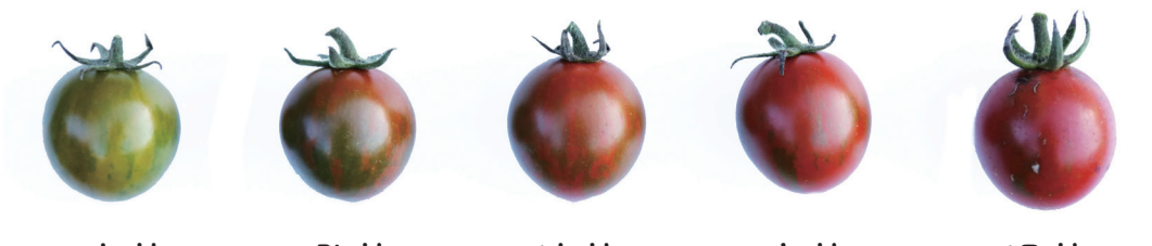
ブラッディタイガー