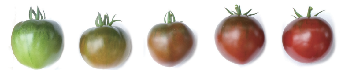
マラケシアンヒップ