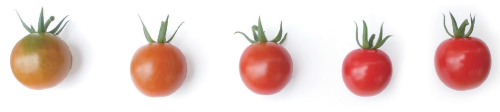
ピッコラルージュ