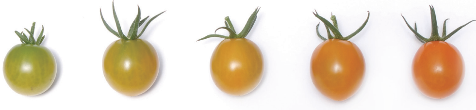
ピッコラカナリア