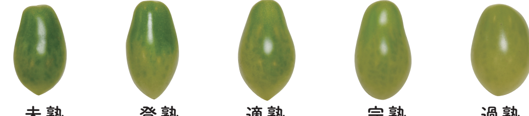
サリーナエメラルド