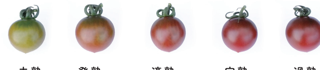
トスカーナバイオレットCF