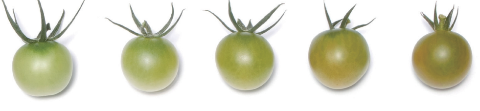
カプリエメラルド