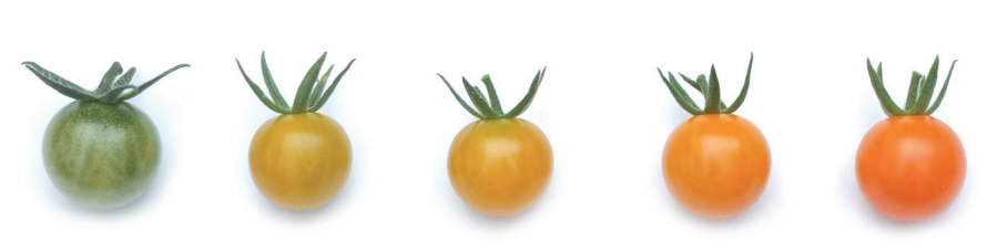
プチポンカナリア