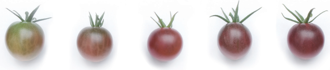
トスカーナバイオレット