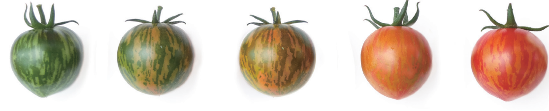
ベネチアンサンセット