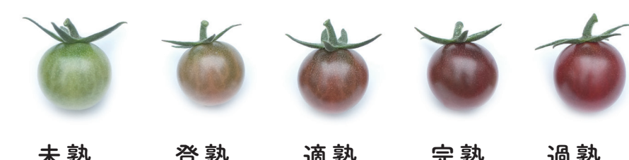
プチポンバイオレット