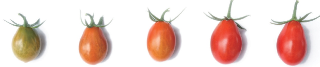
ロッソナポリタン