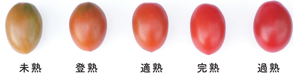
シシリアンルージュ