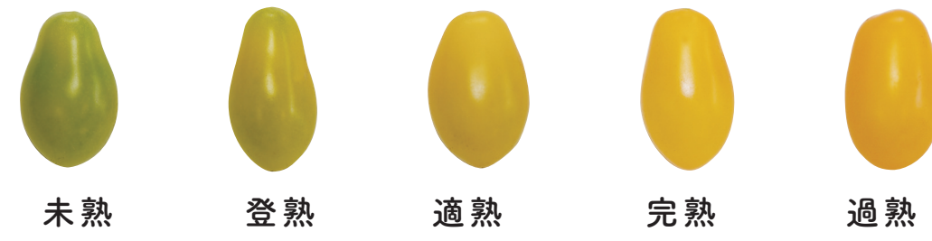
ナポリターナカナリア