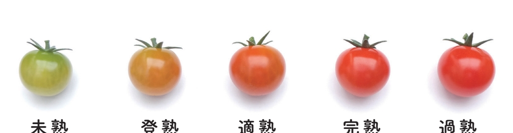
ルージュドボルドー